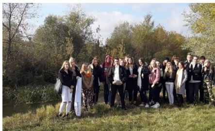
Lekcja geografii w plenerze nad Huczwą

Przedmioty w rozszerzeniu: matematyka, geografia oraz do wyboru: j. angielski, j. niemiecki, j. rosyjski, informatyka, wos, geografia. Zajęcia dodatkowe „Kartografia w praktyce” oraz automatyka.