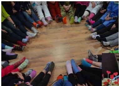
Kawiarenka walentynkowa w auli

Dzień Kolorowej Skarpety - Światowy Dzień Osób z Zespołem Downa