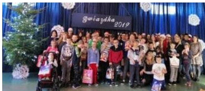
Finał Akcji Młodzież-Dzieciom Gwiazdka w PZPSW. Uczniowie przygotowali spektakl oraz prezenty gwiazdkowe

I Liceum Ogólnokształcące im. ks. Stanisława Staszica ul. 3 Maja 1, 22-500 Hrubieszów