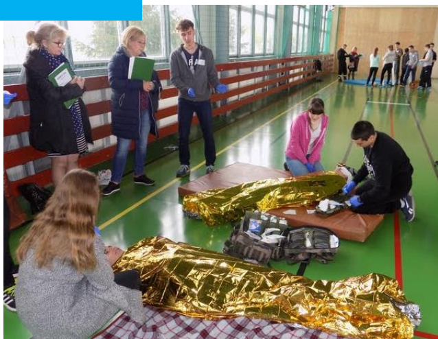
Nasi uczniowie na Rejonowych Mistrzostwach Udzielania Pierwszej Pomocy PCK

Przedmioty w rozszerzeniu: biologia, chemia oraz do wyboru: j. angielski, j. niemiecki, j. rosyjski, informatyka, wos, geografia. Poznacie j. łaćski. Przedmiot uzupełniający: „Elementy ratownictwa medycznego”.