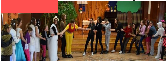
Spotkanie w auli z PZPSW z okazji Dnia Pluszowego Misia

Przedmioty w rozszerzeniu: j. polski, biologia oraz do wyboru: j. angielski, j. niemiecki, j. rosyjski, informatyka, wos, geografia. Poznacie j. łaćski. Zajęcia dodatkowe: „Elementy ratownictwa medycznego”.