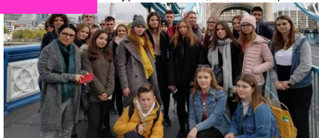
Warsztaty językowe w Londynie

Przedmioty w rozszerzeniu: j. polski, historia oraz do wyboru: j. angielski, j. niemiecki, j. rosyjski, informatyka, wos, geografia. Poznacie j. łaćski. Współpraca z UMCS i IPN. Zajęcia dodatk. „Kultura antyczna”