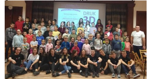
Uczestnicy zajęć Akademii Staśka