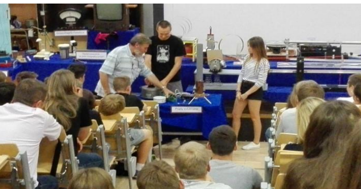
Pokazy fizyczne na UMCS w Lublinie

Przedmioty w rozszerzeniu: matematyka, fizyka oraz do wyboru: j. angielski, j. niemiecki, j. rosyjski, informatyka, wos, geografia. Zajęcia dodatkowe: „Dynamika i kinematyka ciał niebieskich” oraz automatyka