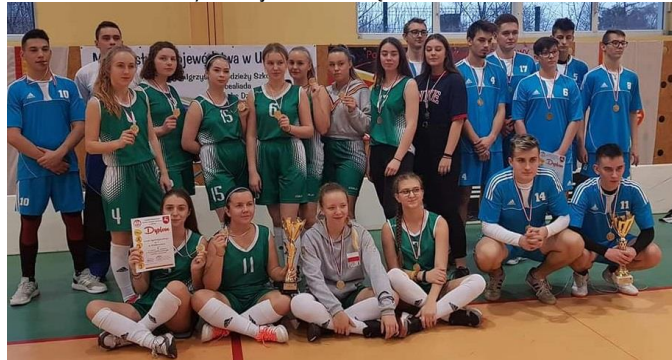
Mistrzowie województwa w unihokeju